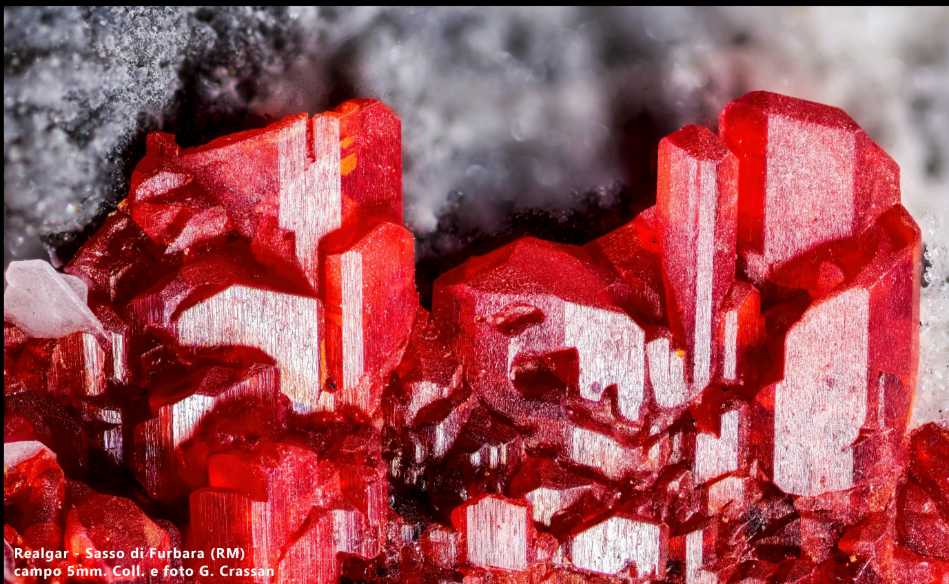
Realgar - Sasso di Furbara (RM) campo 5mm.